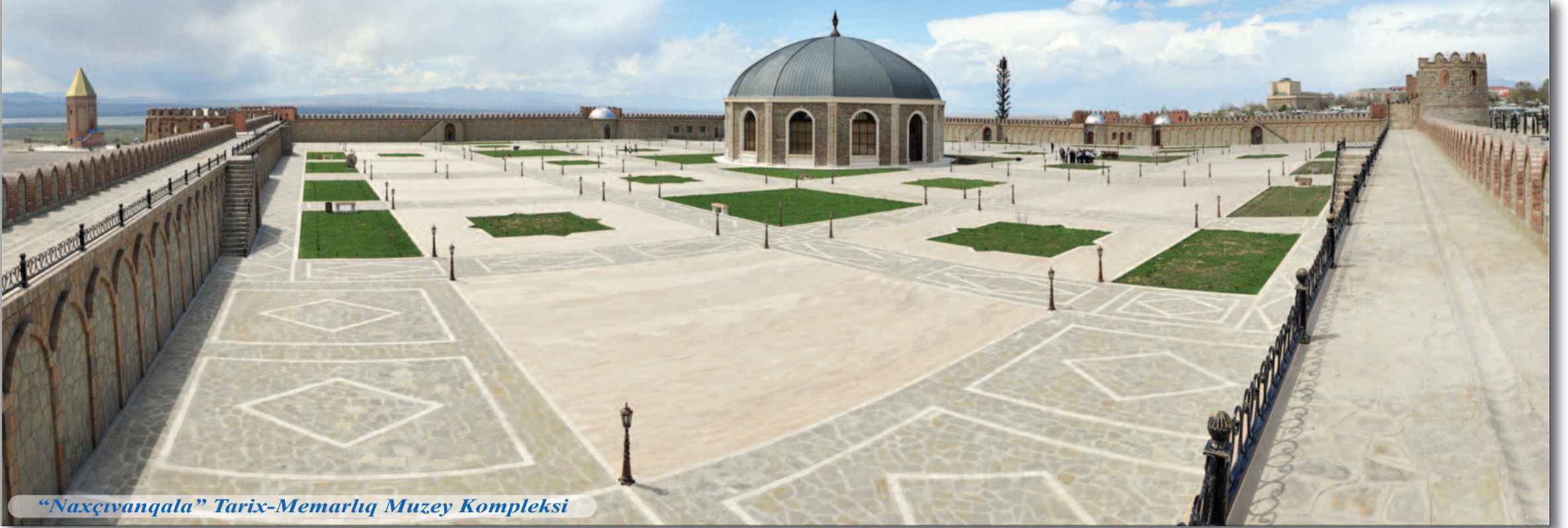
"Naxçıvanqala" Tarix-Memarlıq Muzey Kompleksi