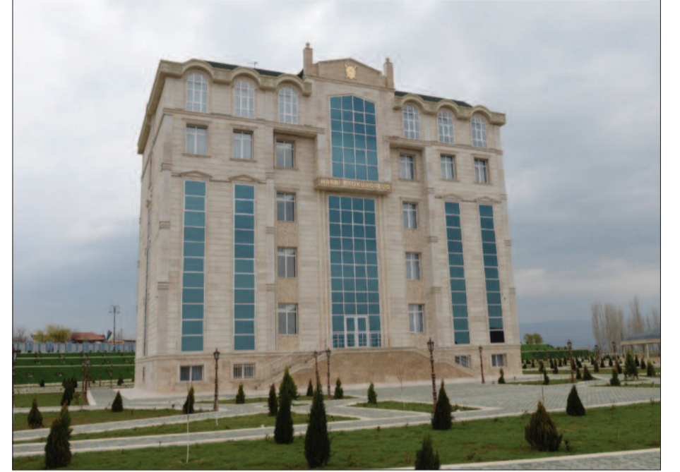
Naxçıvan Muxtar Respublikası Hərbi Prokurorluğunun inzibati binası

Son bir il ərzində Naxçıvanda görülən işlərlə bir daha tanış olarkən gördüm ki, nə qədər böyük işlər görülür, Naxçıvan rəhbərliyi muxtar respublikanın inkişafı üçün nə qədər böyük sevgi ilə, diqqətlə səylər göstərir. Bütün bu uğurlar münasibətilə naxçıvanlıları ürəkdən təbrik edirəm.