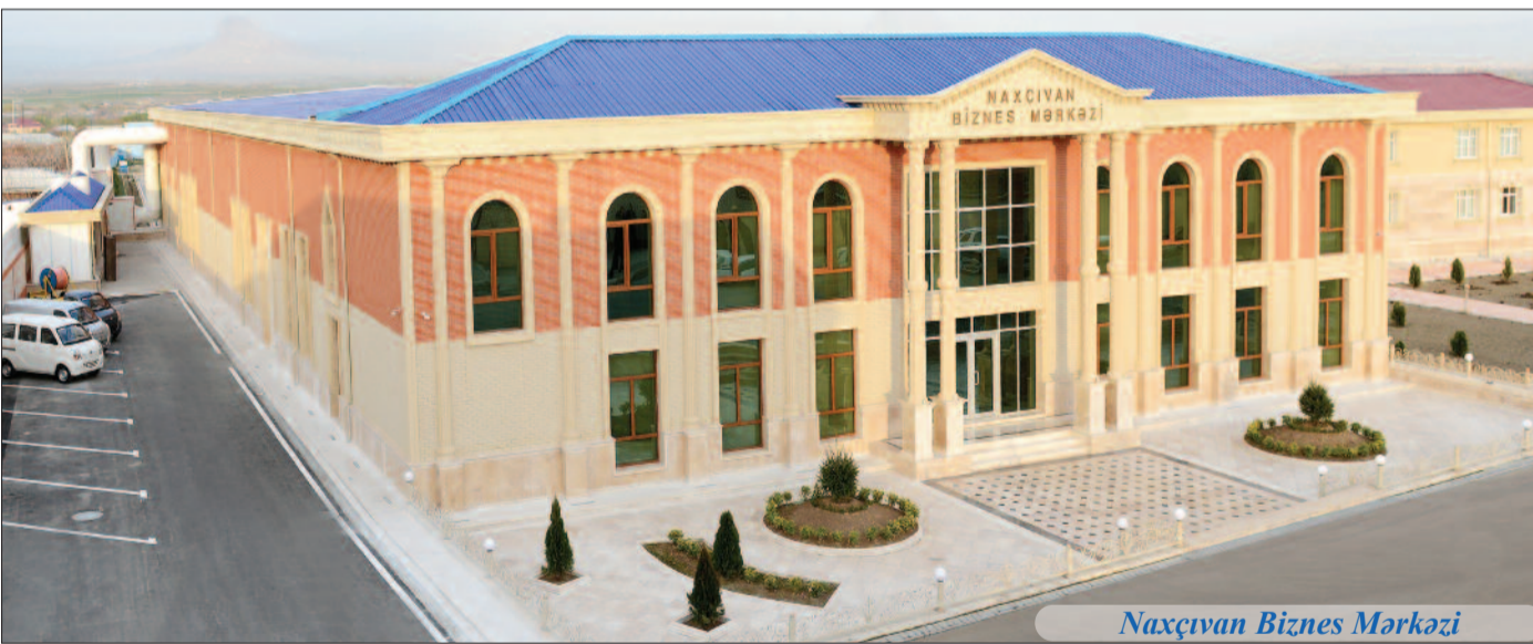
Naxçıvan Biznes Mərkəzi