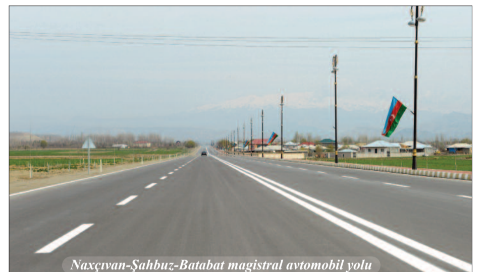
Naxçıvan-Şahbuz-Batabat magistral avtomobil yolu