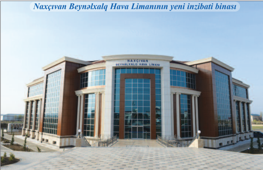
Naxçıvan Beynəlxalq Hava Limanının yeni inzibati binası